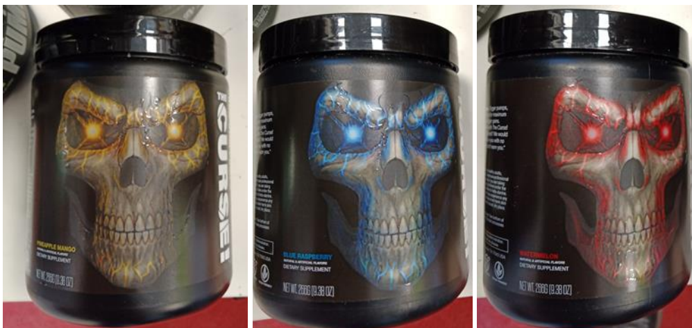
Maisto papildas The Curse!, Non - stim pumps