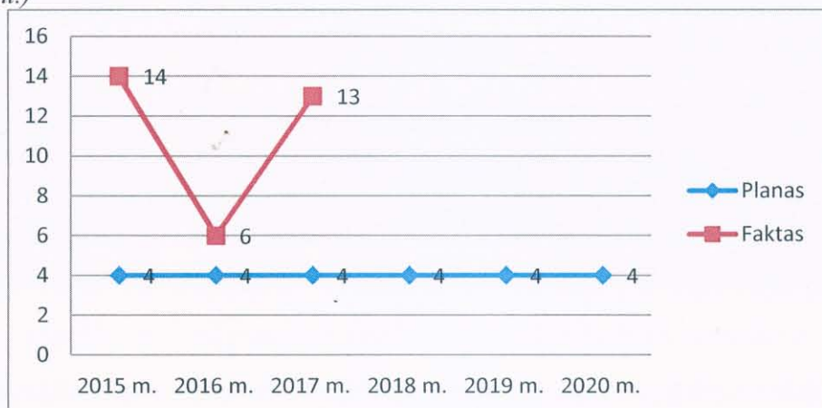
3 grafikas. Suderintų veterinarijos sertifikatų gyvūninio maisto produktų eksportui skaičius per metus (vnt.)

2017 m. buvo suderinta 13 veterinarijos sertifikatų į 7 šalis.