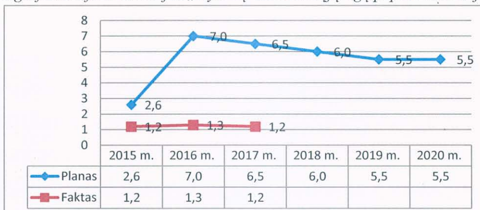
2 grafikas. Efekto kriterijus „Gyvūnų užkrečiamųjų ligų paplitimo mažėjimas“, proc.

Planuota efekto vertinimo kriterijaus reikšmė pasiekta ir viršyta, o tai rodo, kad tinkamai įgyvendinamos užkrečiamųjų ligų kontrolės programos. Buvo vykdomos 4 gyvūnų užkrečiamųjų ligų kontrolės programos: afrikinio kiaulių maro, paukščių gripo, užkrečiamosios spongiforminės encefalopatijos ir pasiutligės.